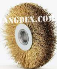
Chip Brush 75mm-13mm