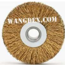
Chip Brush 75mm-13mm