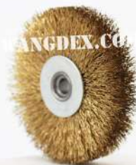
Chip Brush 80mm-8mm