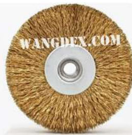
Chip Brush 80mm-8mm