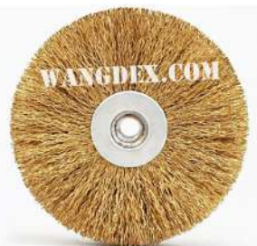
Chip Brush 100mm-8mm