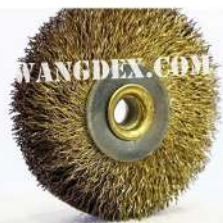
Chip Brush 50mm-6mm