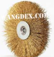
Chip Brush 100mm-8mm

บจก. รุ่งแดง อินดัสเตรียล ซัพพลาย Tel: (038) 337 838-9