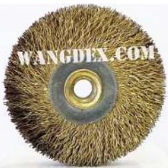
Chip Brush 50mm-6mm